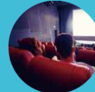
电影院 / KTV