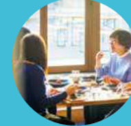
家庭餐馆 / 快餐店