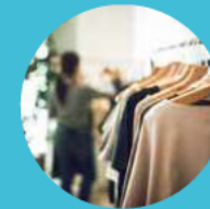
Lojas de vestuários