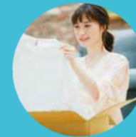
Compra pela internet