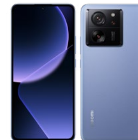
アルパインブルー