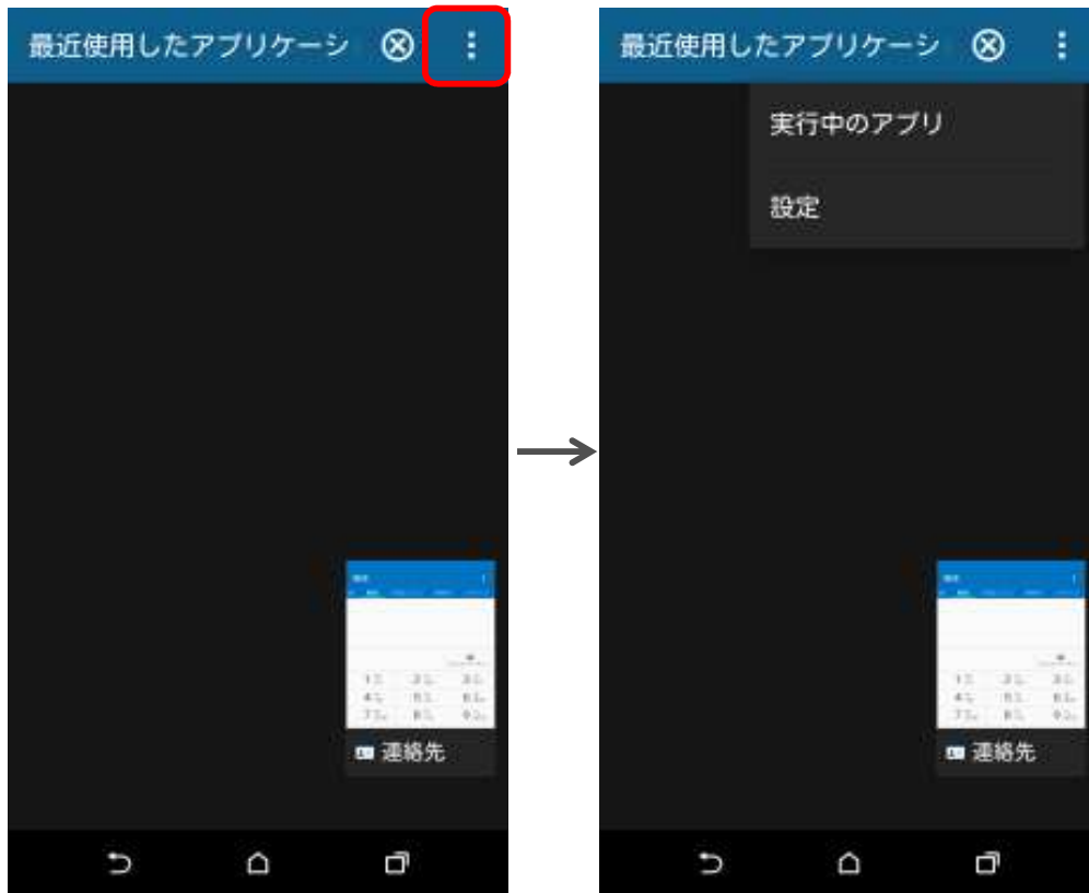
Android™ 5.0 (従来)