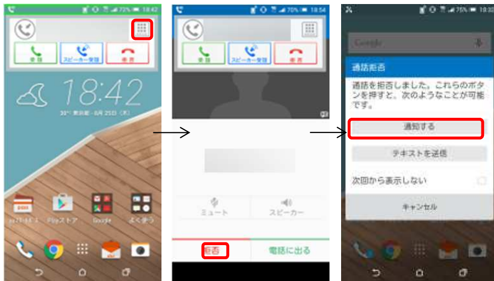
Android™ 5.0 (従来) 端末動作時