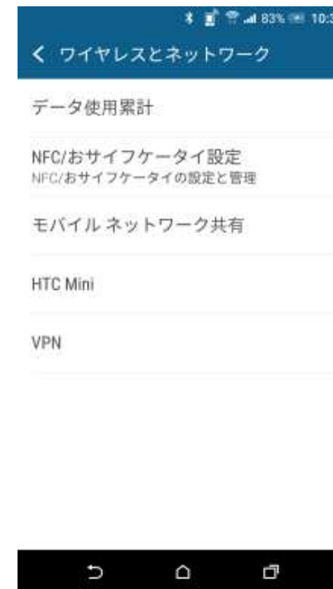
Android™ 6.0 (更新後)