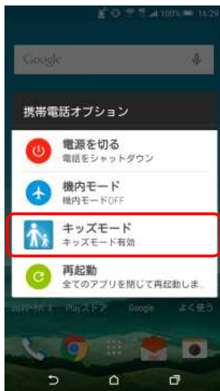
電源キー長押し画面