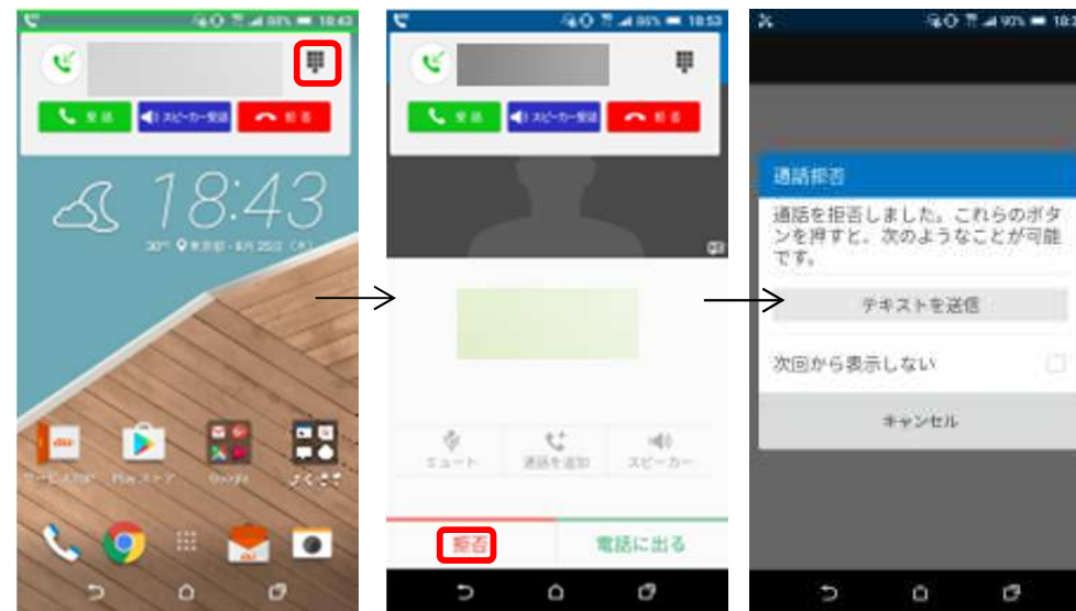
Android™ 6.0 (更新後) 端末動作時