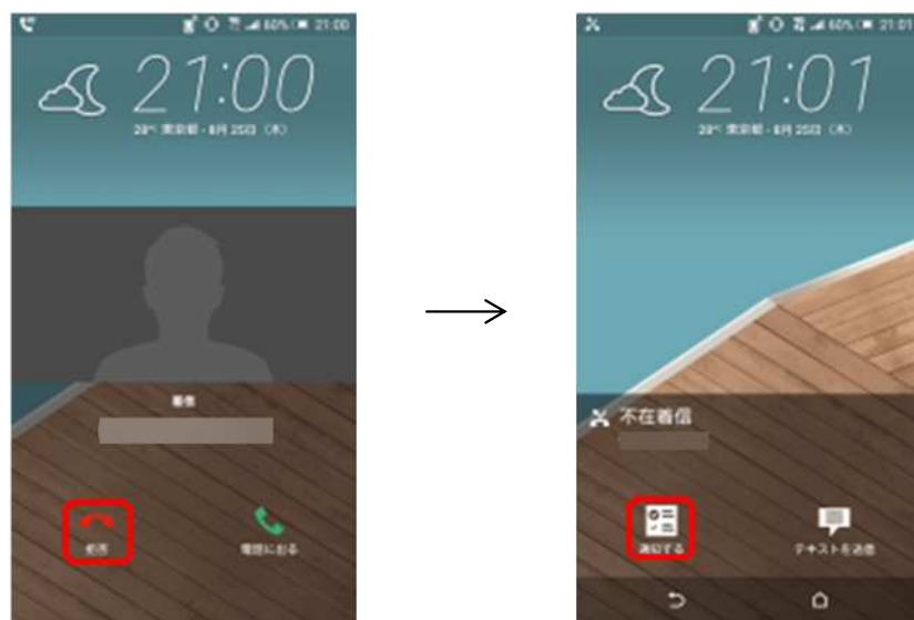
Android™ 5.0 (従来) 端末スリープ時