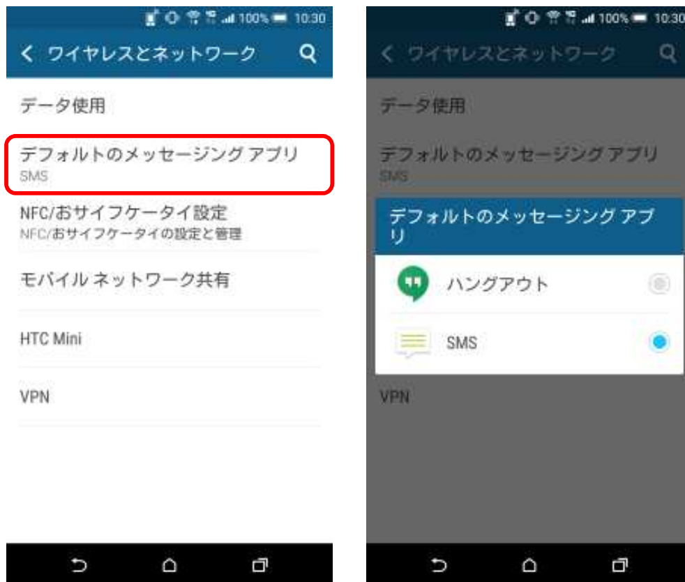
Android™ 5.0 (従来)

デフォルトのメッセージングアプリ設定が削除されます。 OSアップデート前の設定はアップデート後も引継ぎされます。