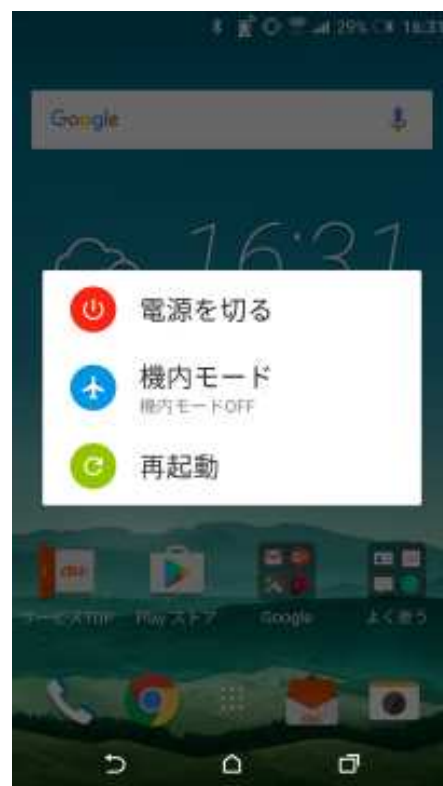
電源キー長押し画面